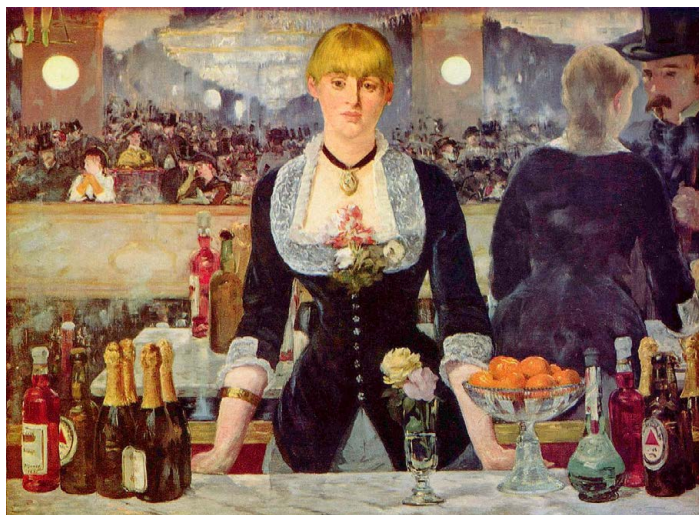
Фото 5. Эдуард Мане. Бар в «Фоли-Бержер», 1882.

ца XVII века Яна Стена Блэкмон начинает свое художественное кредо. 20