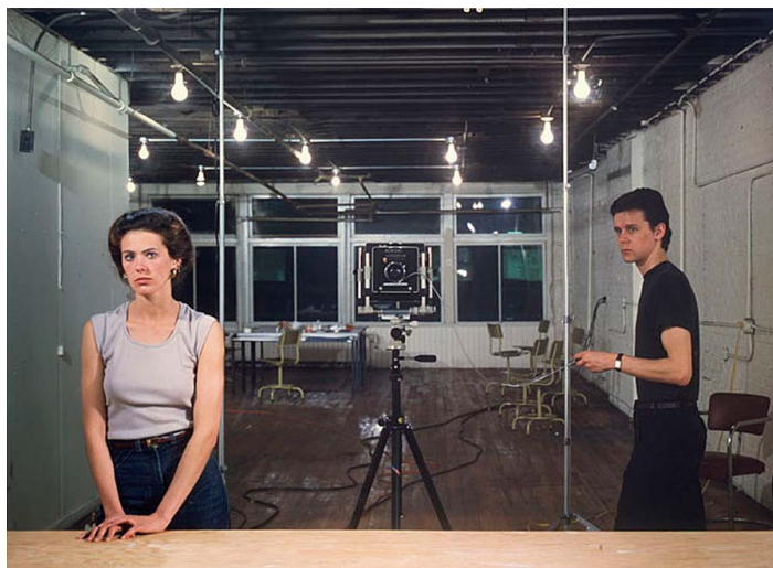
Фото 4. Джефф Уолл. Picture for Women, 1979.

| Повседневность между реальностью и фантазмом: фотографии Джули Блэкмон |