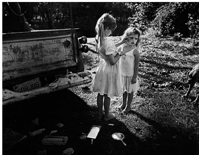
Фото 3. Салли Манн. Из альбома Immediate Family , 1992.

Работы Уолла, историка искусства по образованию, представляют невероятно плодотворную почву для рассуждения об условиях и природе взгляда в фотографии. 17 Он использует постановочность и многоступенчатую компьютерную обработку, собирая изображение из нескольких предварительно отснятых фрагментов. У ряда работ Уолла есть прямые прототипы из числа живописных 18 или графических произведений, при том что связь между работами разных эпох не так уж очевидна. Многие зрители испытывают изрядное потрясение в момент предъявления им прототипа.