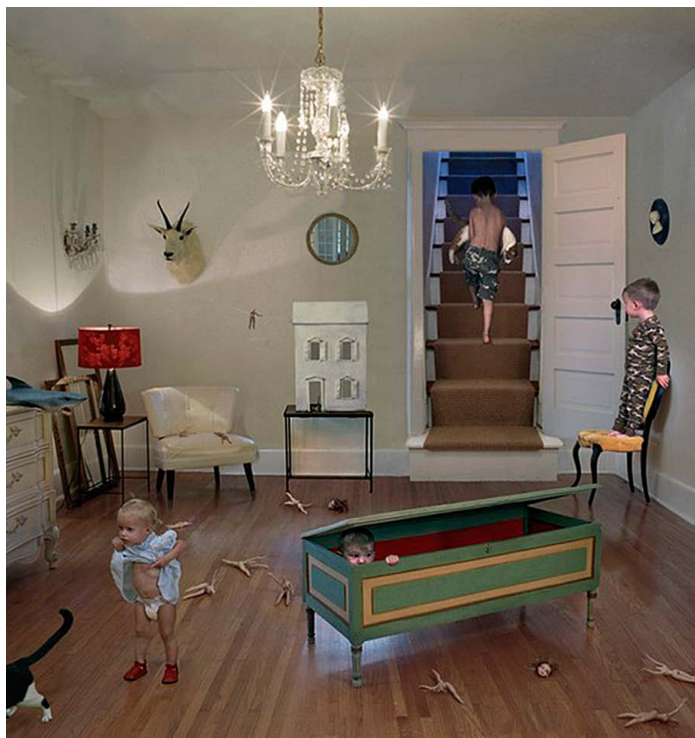
Фото 1. Джули Блэкмон. Камуфляж, 2006.

| Повседневность между реальностью и фантазмом: фотографии Джули Блэкмон |