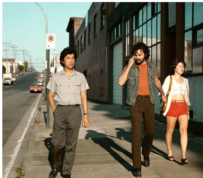
Фото 6. Джефф Уолл. Передразнивающий, 1982.