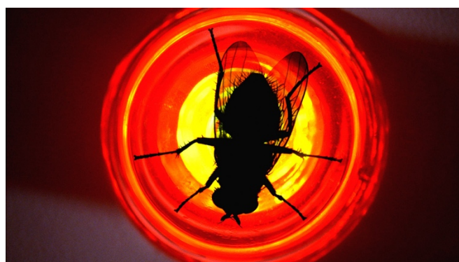
Рис. 2 Стоп-кадр телесериала «Во все тяжкие» («Breaking Bad», 2008–2013).

Еще одна значимая черта, заставляющая связывать эпизод с абсурдистской поэтикой, – его трагикомичность. Во-первых, сам Уайт, нищепанский герой, гений, добивающийся своих целей при помощи научного метода и выдающегося интеллекта, здесь выглядит предельно комично, просто гоняясь за насекомым. Комичны споры персонажей в начале эпизода, в которых Джесси выглядит более адекватным, чем его учитель: «So you're chasing around a fly and in your world, I'm the idiot?» 10 .