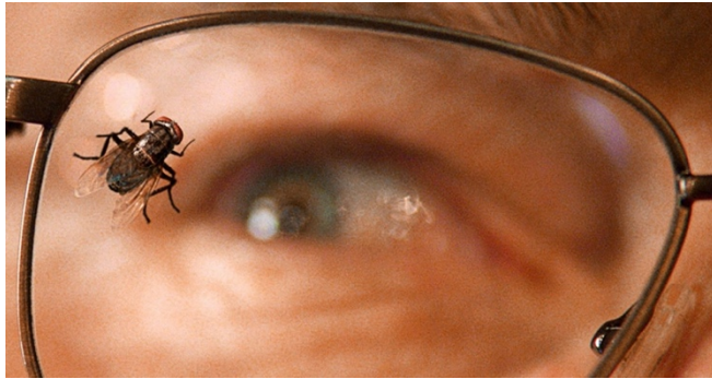
Рис. 3 Стоп-кадр телесериала «Во все тяжкие» («Breaking Bad», 2008–2013).

видим, как муха садится на стекло очков, а Уолтер пристально смотрит на нее (рис. 3). Очевидно, что за образом мухи скрываются нерешенные проблемы и комплексы.