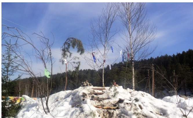
Рис.2. Жылгайак , с. Кебезень, Турочакского района, фото из архива Д.А. Аткуновой.

Ритуальный этап обряда освящения праздника мургуул также описан в статье Д. А. Аткуновой «Материалы по традиционным праздникам коренных малочисленных народов северного Алтая». Финальной частью описанного обряда является повязывание ритуальной ленточки жалама .